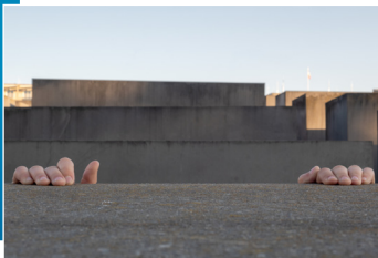
Tun ORIGER Médaille d'or Sujet libre Juniors I