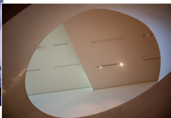
Tun ORIGER Médaille d'or Sujet imposé Juniors I